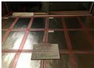
改修内容: 床に真空断熱材を敷き込みました。床にも真空断熱材をはりつけました。