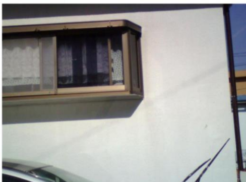
サーモカメラによる、断熱補強の必要な場所と筋交いの有無を確認しました。

H様邸改修工事(広島) 耐震診断と耐震改修設計 耐震工事補助申請の代行(自治体 認定額 60万※)