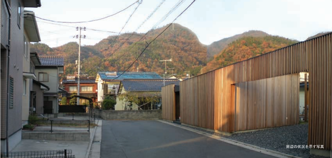
周辺の状況を示す写真