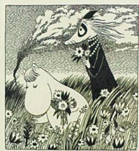
トーベ・ヤンソン「ムーミン谷の夏まつり」挿絵 インク、1954年

掲載作品すべてタンペレ市立美術館・ムーミン谷博物館 ©Moomin Characters™ Tampere Art Museum Moominvalley