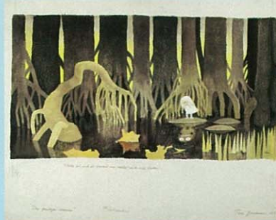
トーベ・ヤンソン「ムーミン谷へのふしぎな旅」挿絵 インク・水彩、1976年

掲載作品すべてタンペレ市立美術館・ムーミン谷博物館 ©Moomin Characters™ Tampere Art Museum Moominvalley