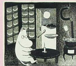
トーベ・ヤンソン「ムーミン谷の冬」挿絵 インク、1957年