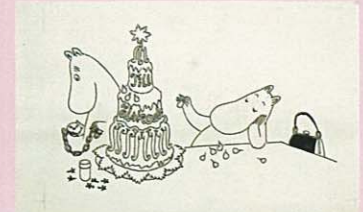
トーベ・ヤンソン「ムーミン谷の誕生日」挿絵 インク、1968年