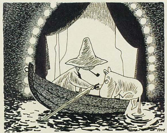
トーベ・ヤンソン「ムーミン谷の夏まつり」挿絵 インク、1954年