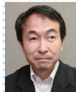
コーディネーター

広島デザイナー学院卒業。舞台美術制作会社勤務、イラストレーターを経て1990年に企画会社(株)ハーストリーを設立。2009年に独立し(株)ハーストリープラスを設立。「食」を中心とした企画・マーケティング事業や、お弁当販売&食材shop「HER STORY HOUSE DELI KITCHEN」(ハーストリーハウスデリキッチン)を運営。母親目線、生活者視点での地域活性化事業を展開している。