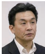
基調講演者・パネリスト