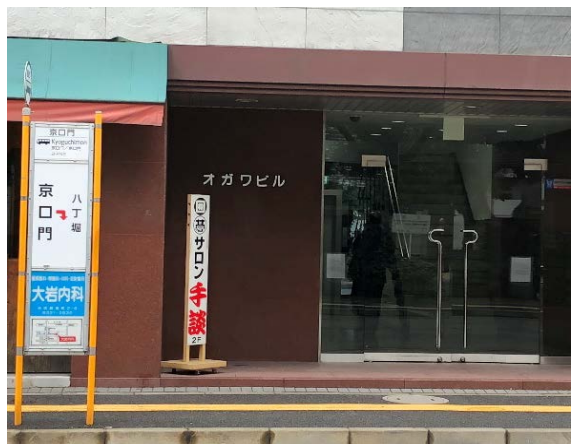
⑥オガワビル2階へ上がる

◆一般社団法人 広島県建築士事務所協会◆ 〒730-0013 広島市中区八丁堀5-23オガワビル2F TEL:082-221-0600 ・ FAX:082-221-8400 E-Mail: info@h-aaa.jp