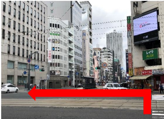
①広電八丁堀電停を下車後、横断歩道を渡って左折