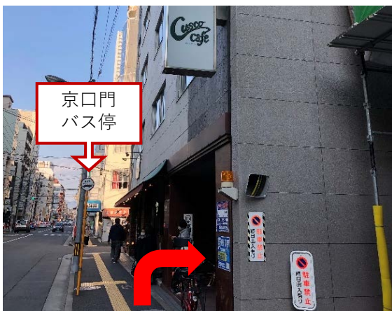
⑤京口門バス停まで直進