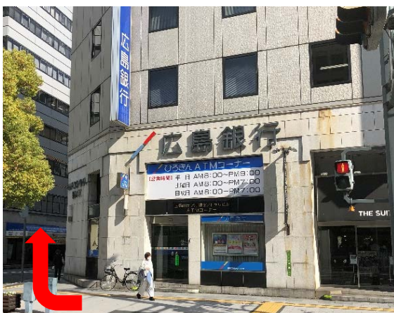
③ZARAとひろぎんATMコーナーの間の通りを左折