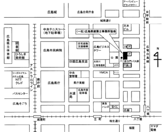
(一社) 広島県建築士事務所協会の付近見取り図 ※無料駐車場なし