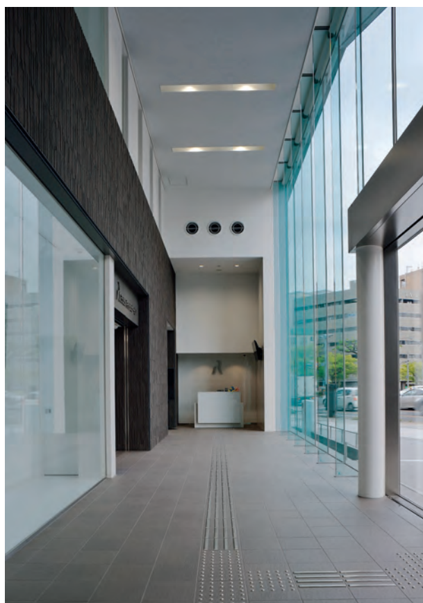
エントランスギャラリー