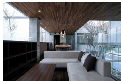
リビングからキッチンを見る